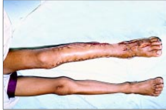
Figura 3. Fasciotomía en menor de edad.

Todos los pacientes recibieron suero antiofídico polivalente; el promedio de ampollas usadas en los pacientes fue de 6,5, con una media de 5; la máxima dosis recibida por un accidentado fue de 20 ampollas. Cuarenta de los pacientes (75%) atendidos recibieron dos antibióticos; siete (13%), uno solo, y el resto recibió más de dos antibióticos. Los antibióticos más usados fueron la penicilina (41 casos) y la gentamicina (32 casos). Otros